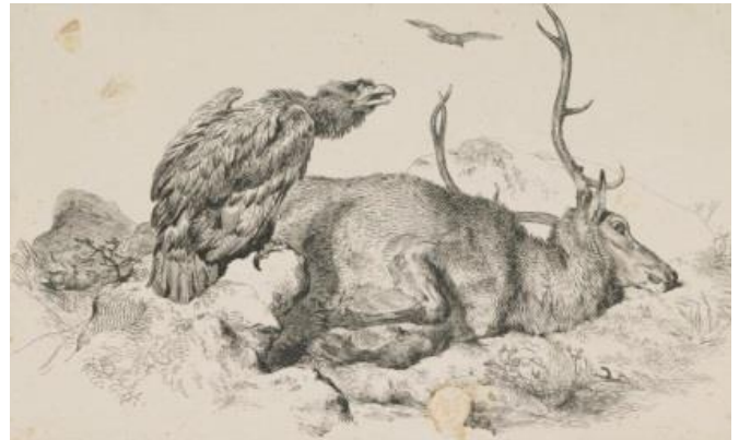
Sir Edwin Landseer, An Iolaire, 1848