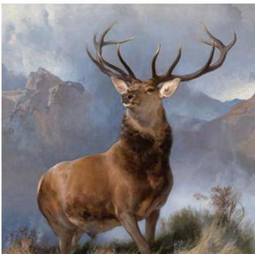
Sir Edwin Landseer, Monarc a' Ghlinne (mu 1851).

A rèir coltais, bha Landseer na dhuine anabarrach dìorrasach agus tapaidh. A dh'aindeoin brisidhean-dùil pearsanta, bha e dealasach air ealain a dhèanamh, gu h-àraid peantadh ainmhidhean.