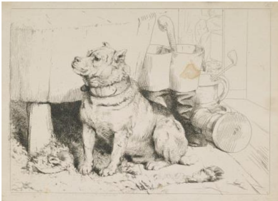
Sir Edwin Landseer, Beatha Iriosal, 1843

Chan fhaighear an seo ach grunn de na h-obraichean-ealain a rinn Landseer, a bharrachd air obraichean-ealain eile a tha co-cheangailte ri slàinte agus sunnd.