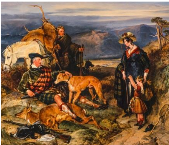
Sir Edwin Landseer, Sealladh air a' Ghàidhealtachd, le dealbhan-dhaoine de Bhan-diùc Bedford, Diùc Gordain agus am Morair Alasdair Ruiseal 1825-28