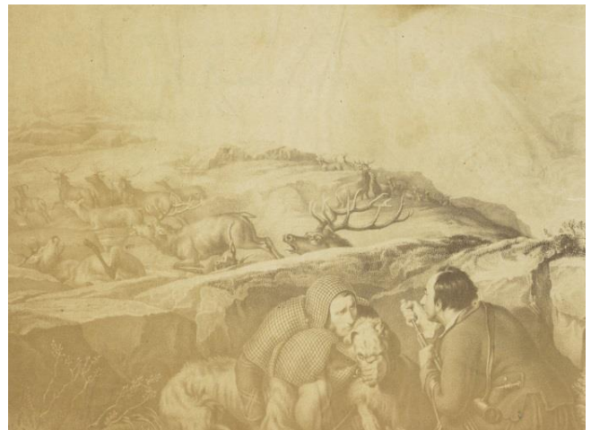
Neo-aithnichte agus Sir Edwin Landseer, Coille Ghleann Urchaidh. Ceann-latha neo-aithnichte