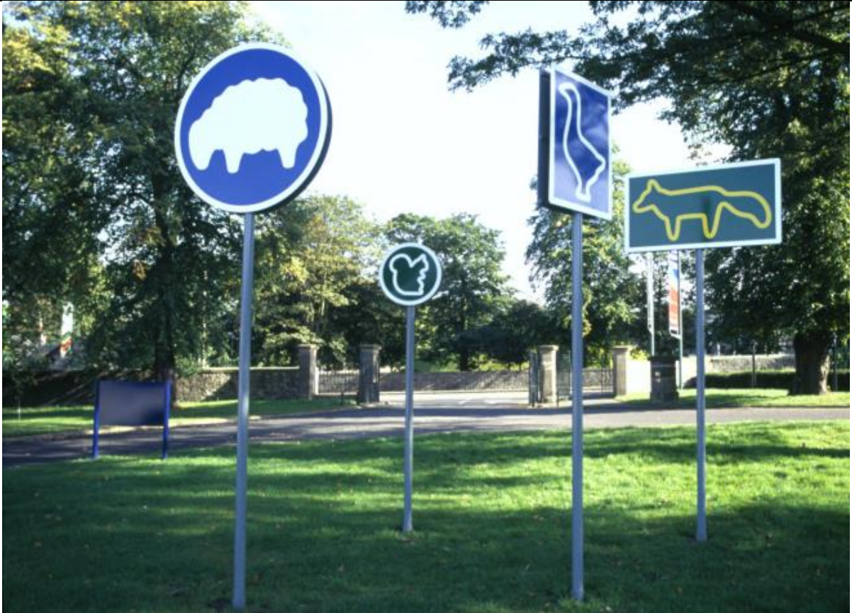
Julian Opie, Ainnhidhean air theicheadh 2002 Air a choimiseanadh agus air a thaisbeanadh le BALTIC, Gateshead, gus am fosgladh aca a chomharrachadh 2002 © Julian Opie, le cead (gailearaidh) 2017.