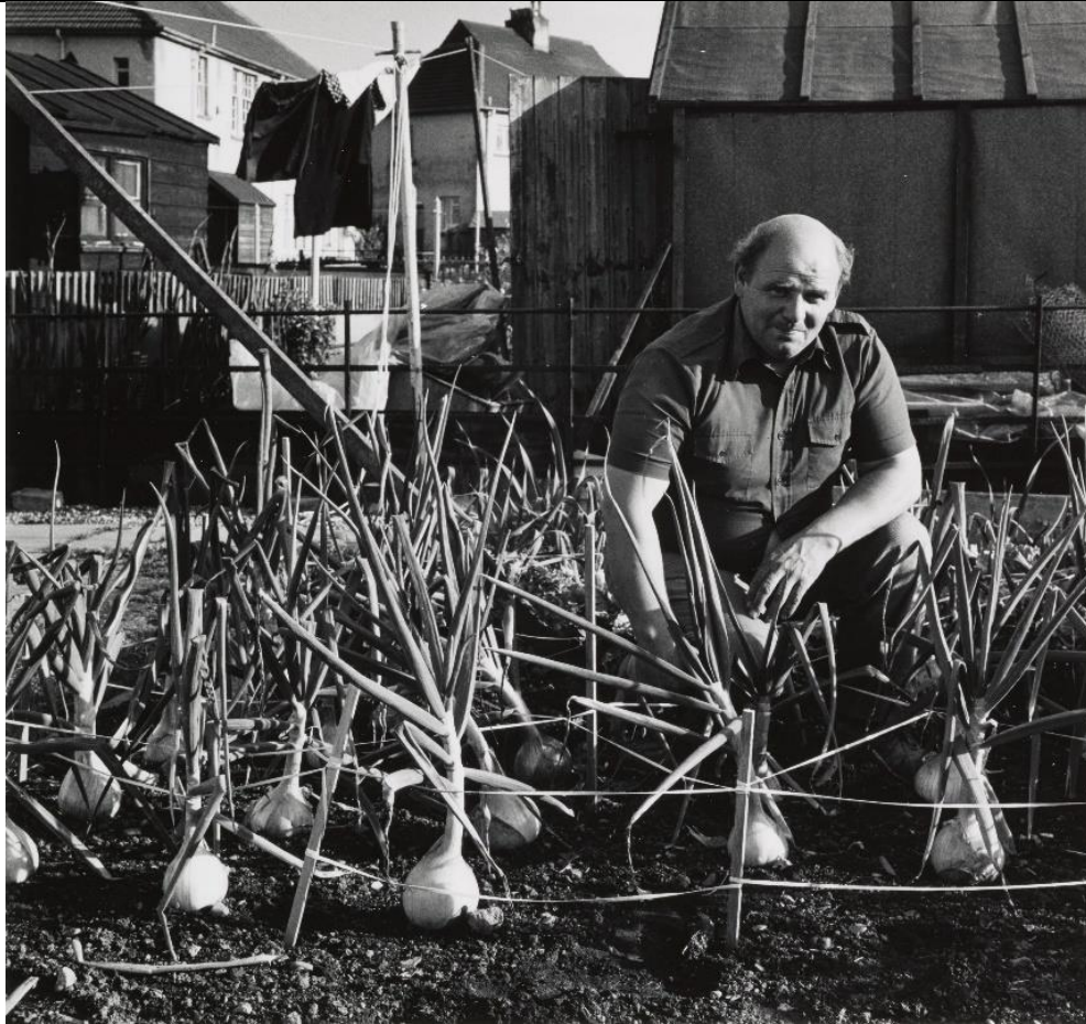
Milton Rogovin, Mèinneadairean Albannach 1982 © Center for Creative Photography.