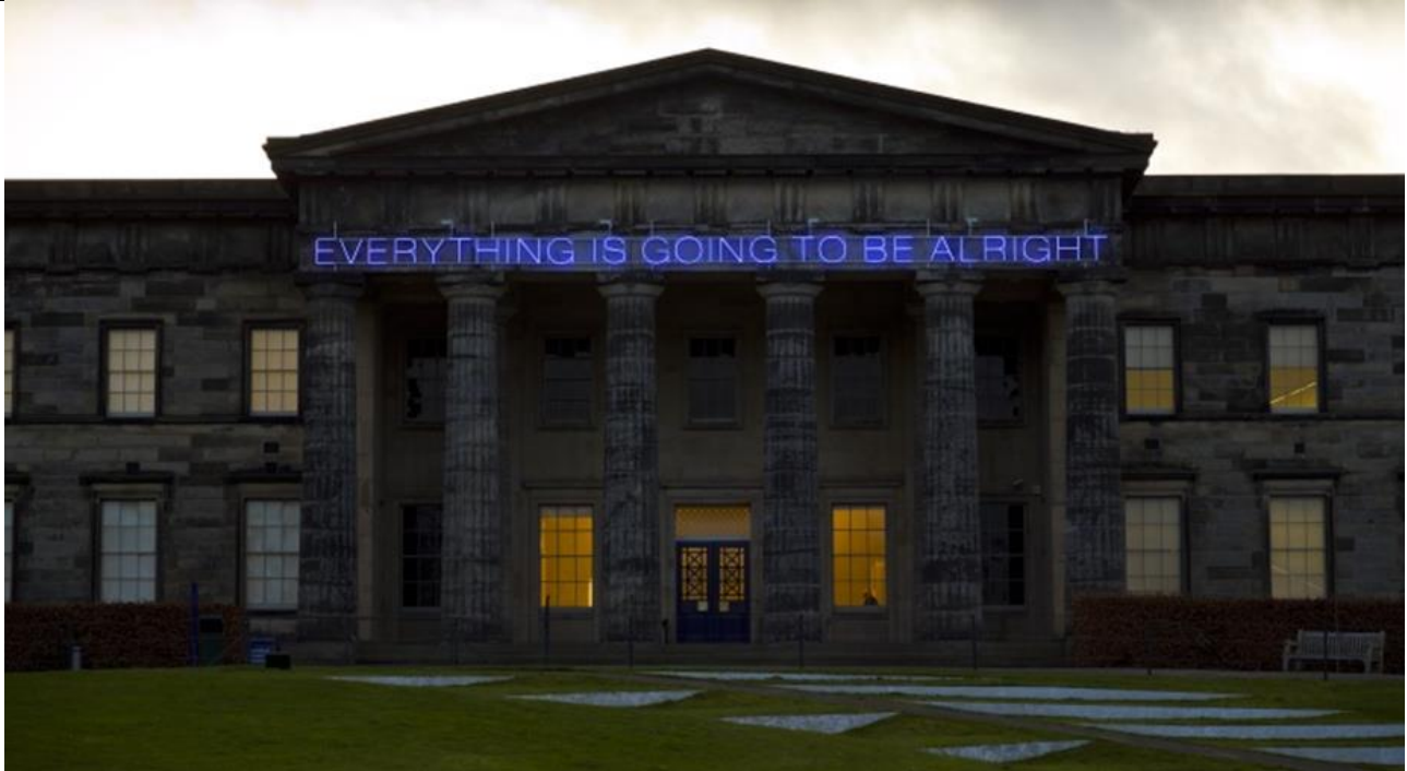
Martin Creed, No.975 BIDH A H-UILE RUD GU MATH 2008 Air a thaisbeanadh leis an neach-ealain 2012 (cosgaisean cruthachaidh pàighte leis a' mhaoin Iain Paul Fund) © Martin Creed