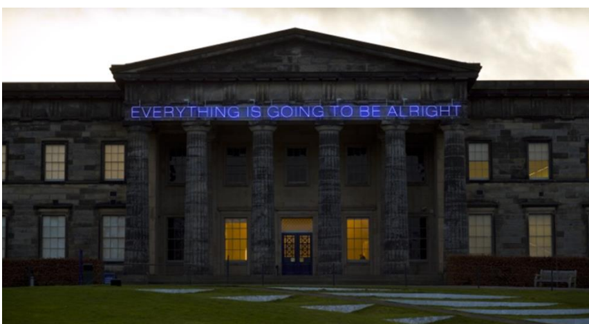
Martin Creed, No.975 BIDH A H-UILE RUD GU MATH 2008 Air a thaisbeanadh leis an neach-ealain 2012 (cosgaisean cruthachaidh pàighte leis a' mhaoin Iain Paul Fund © Martin Creed