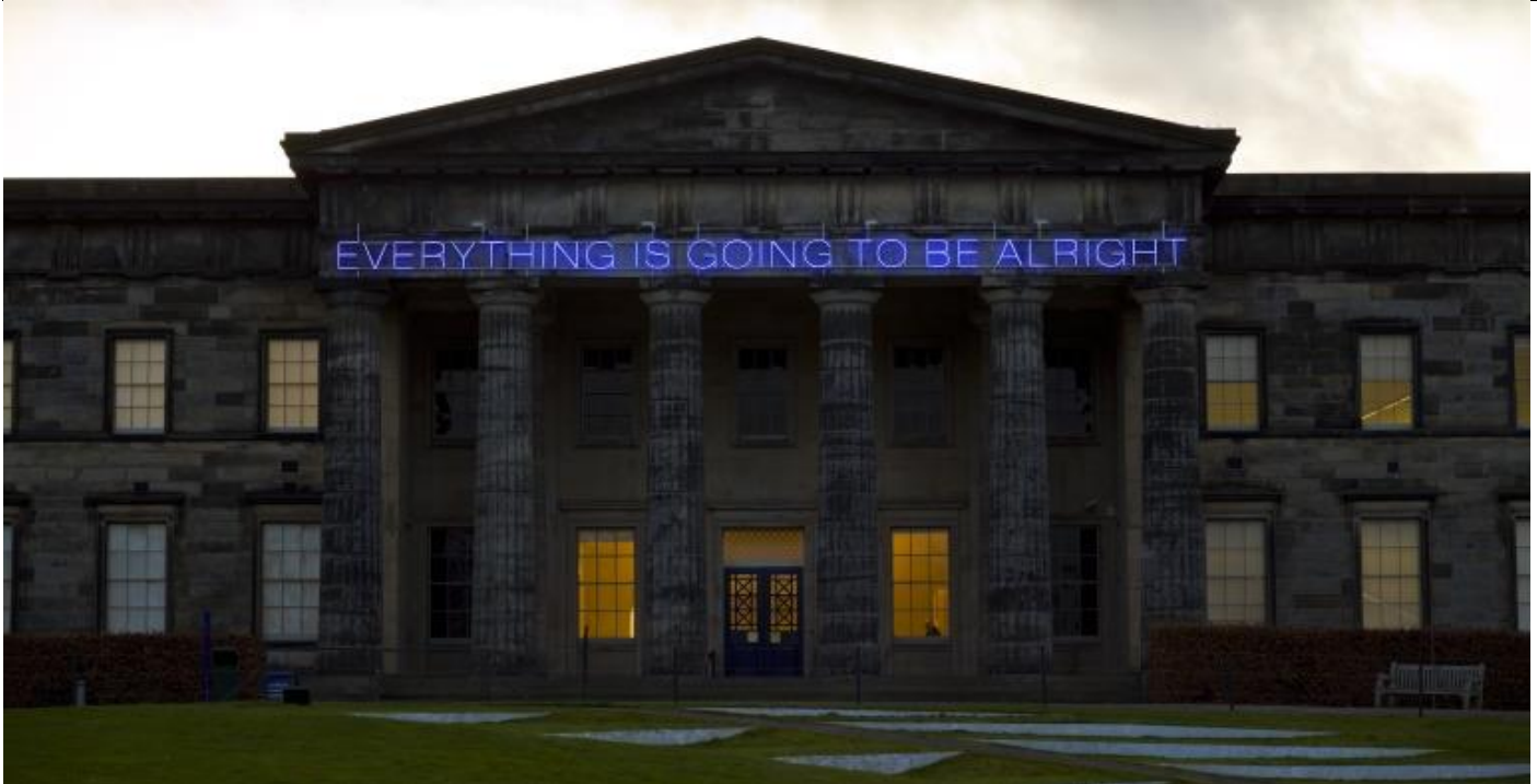
Martin Creed, No.975 BIDH A H-UILE RUD GU MATH 2008 Air a thaisbeanadh leis an neach-ealain 2012 (cosgaisean cruthachaidh pàighte leis a' mhaoin Iain Paul Fund)

Tha seo mar phàirt de shreath de ghoireasan a tha a' dèiligeadh ris a' chuspair Fèin-aithe Albannach: Cò aige a tha an co-dhùnadh air cò th' annainn? Tha an earrann seo a' cleachdadh Monarc a' Ghlinne agus obraichean-ealain buntainneach eile gus slàinte agus sunnd a chur fon phrosbaig, a' tairgse ìomhaighean, ceistean agus gnìomhan a dh'fhaodar rannsachadh le luchd-ionnsachaidh de gach aois.