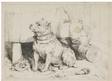
Sir Edmin Landseer, Beatha Iriosal 1843