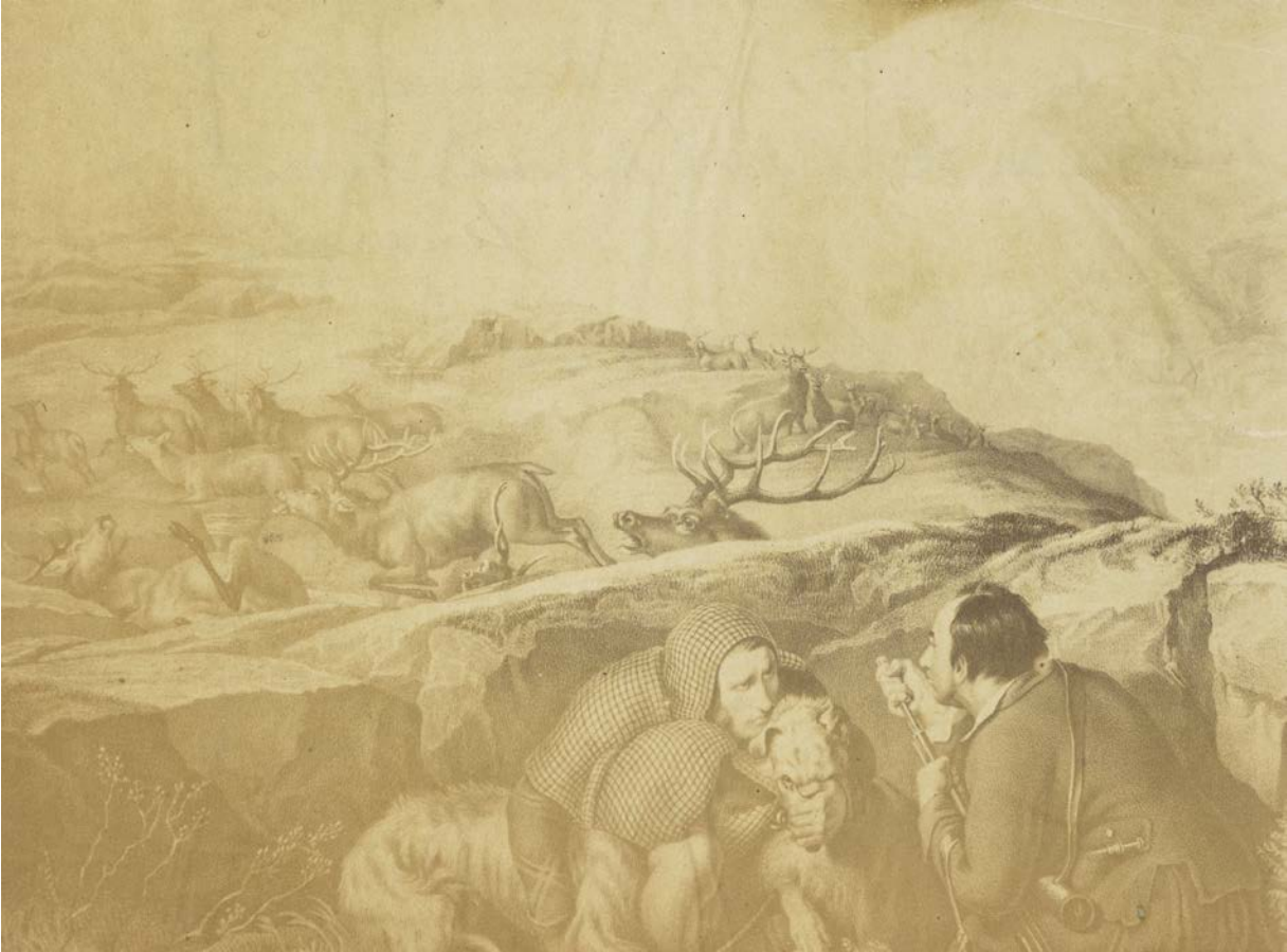
Neo-aithnichte agus Sir Edwin Landseer, Coille Ghleann Urchaidh. Ceann-latha neo-aithnichte

Tha seo mar phàirt de shreath de ghoireasan a tha a' dèiligeadh ris a' chuspair Fèin-aithne Albannach: Cò aige a tha an co-dhùnadh air cò th' annainn? Tha an earrann seo a' cleachdadh Monarc a' Ghlinne agus obraichean-ealain buntainneach eile gus an àrainneachd againn a chur fon phrosbaig, a' tairgse ìomhaighean, ceistean agus gnìomhan a dh'fhaodar rannsachadh le luchd-ionnsachaidh de gach aois.