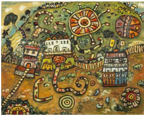
Alan Davie, Dreach-tìre seunta [Opus O.1337] Dèante 1996 © Oighreachd Alan Davie