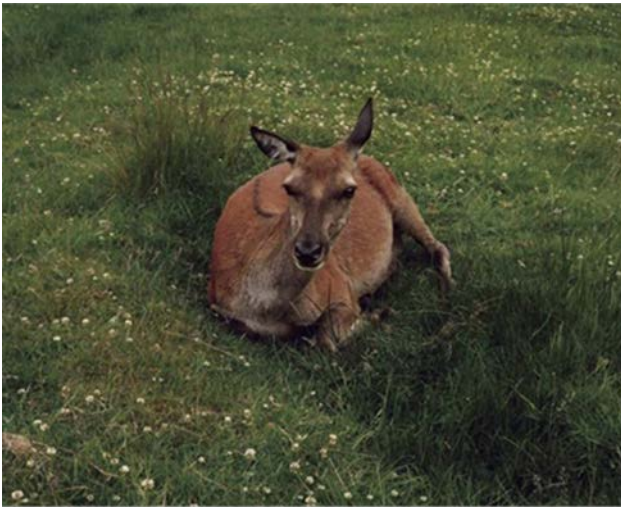
Eva Vermandel, Fiadh, Eilean Arainn, 2009, ©Eva Vermandel

Gleann Urchaidh ann an Earra-Ghàidheal, Gleann Chuaich ann an Siorrachd Obar Dheathain agus na Tròisichean, ach dh'fhaodadh gu bheil an dealbh gu tur uirsgeulach. Pheant e an dealbh anns an stiùideo aige ann an Lunnainn.