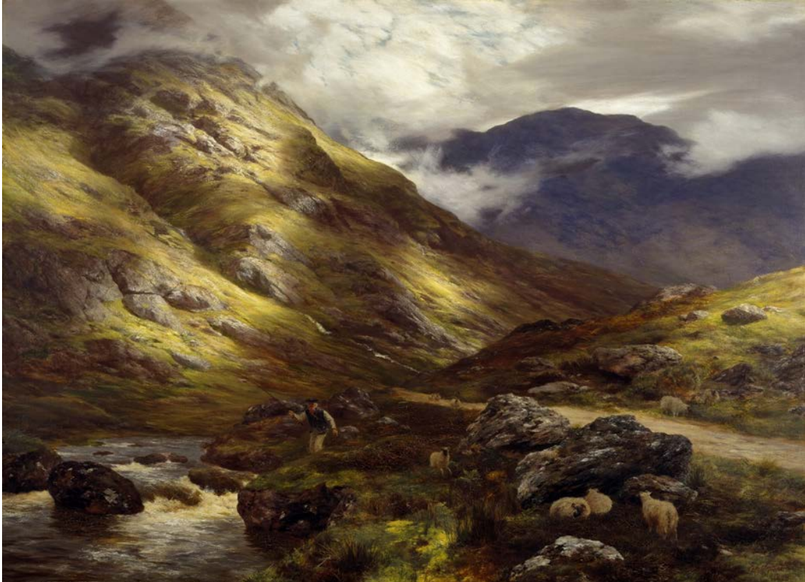
Peter Graham, Sgàilean Seachranach, 1878