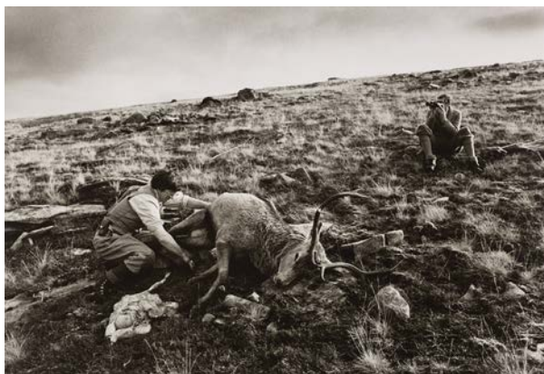
Glyn Satterley, Fear a' greallach damh, Oighreachd Coille Mheadhrath. Dèante mu 1980 © Glyn Satterley