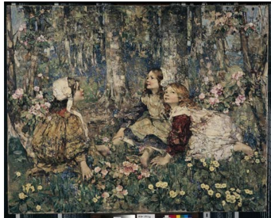
Edward Atkinson Hornel, Ceòl na Coille, 1906