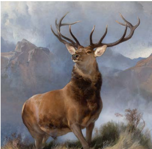
Sir Edwin Landseer, Monarc a' Ghlinne (mu 1851).

Dh'obair Landseer ann an Lunnainn, ach bha e air a' bheò-ghlacadh le Alba. Fad iomadh bliadhna, rinn e tursan bliadhnaile gu Alba gach foghar airson sgeidseadh dhealbhan, sealgaireachd agus iasgachd. Chòrd e ris a bhith a' coiseachd tro na gleanntan agus na beanntan gus brosnachadh fhaighinn airson nan dealbhan aige. Anns an ochdamh linn deug, le slugh a bha a' fàs nas gnìomhachasaichte agus nas bailteil, bha e a' còrdadh ri daoine a bhith a' faighinn air falbh bho bheatha làitheil tro ìomhaighean an fhàsaich agus cuspairean cian-thìreach, allamhara.