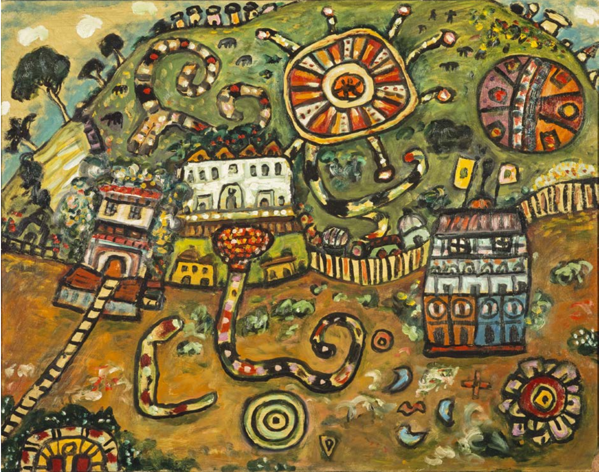
Alan Davie, Dreach-tìre seunta [Opus O.1337] 1996 © Oighreachd Alan Davie