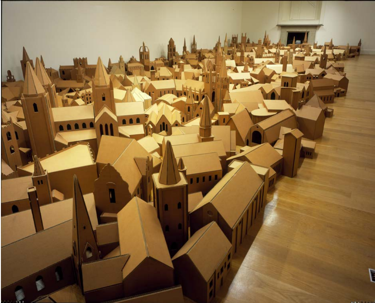
Nathan Coley, Lampa na h-ìobairt, 286 Àitichean adhraidh, Dùn Èideann 2004. Dèante 2004 ©Stiùideo Nathan Coley